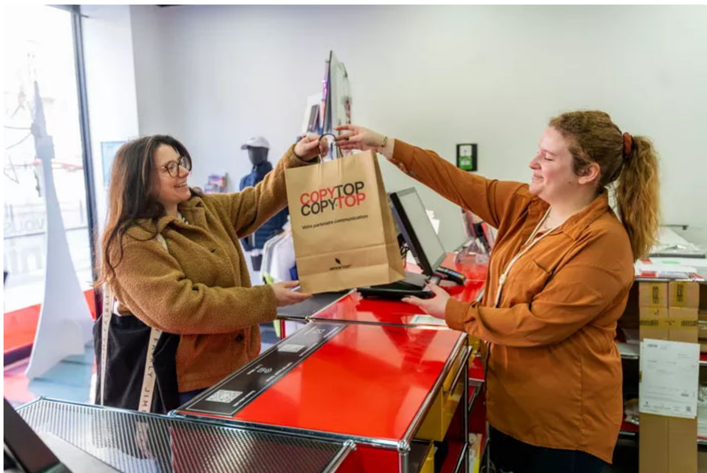
COPYTOP, le partenaire communication des entreprises COPYTOP

Contenu conçu et proposé par L'équipe du Figaro Services. La rédaction n'a pas participé à la réalisation de cet article.